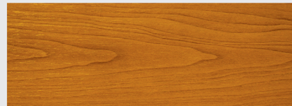
สีไม้สักทอง Autumn Oak H217