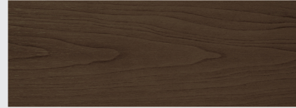
สีไม้ประดู่ Afromosia 003