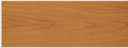
สีด้านใส Matt Clear X200