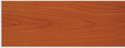
สีออกโทเบอร์บราวน์ October Brown X77