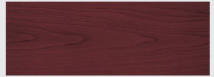
สีเมอร์ไบ Merbau X180