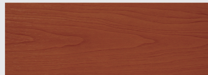
สีไม้แดง Redwood H216