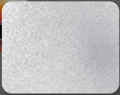
กัลวาไนซ์