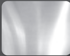
อะลูมิเนียม