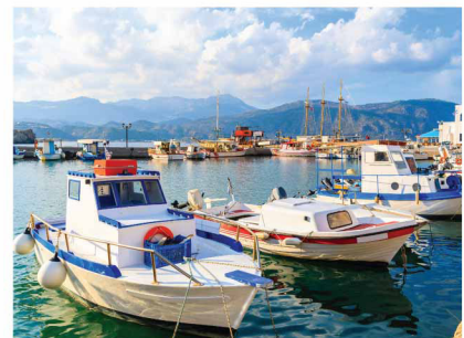
ทาสีเรือไม้ เรือเดินสมุทร