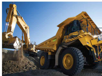
รถแทรกเตอร์