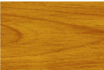
G-1902 สีไม้สักห้าดาว / Premium Teak