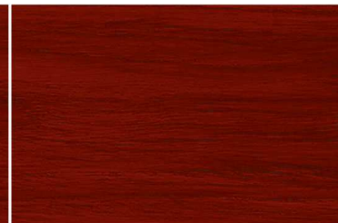
G-1914 สีไม้พะยูน / Siamese Rosewood