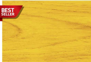
G-1901 สีไม้สักทอง / Golden Teak