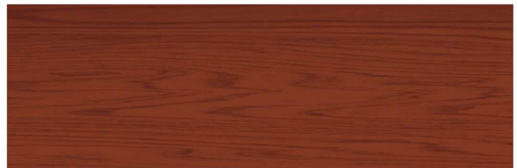
สีไม้แดง Red Wood