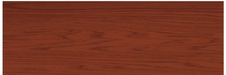
สีไม้แดง Red Wood