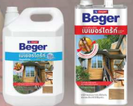
สูตรน้ำ สูตรน้ำมัน

เพื่อการปกป้องไม้จากปลวกและเชื้อรา แนะนำการใช้ เบเยอร์ไดร์ก ซันดากา สีใส สูตรน้ำ หรือ สูตรน้ำมัน จำนวน 1 เทียว หลังจากเตรียมพื้นผิว