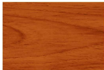
G-1905 สีไม้แดง / Redwood