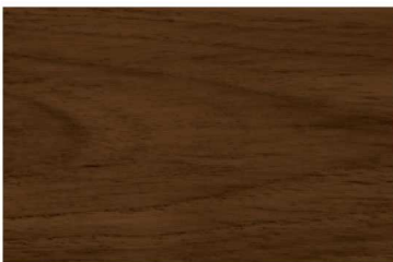
G-1904 สีไม้ประจู่ / Afronesia