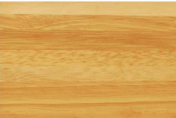
G-1900 สีใส / Transparent