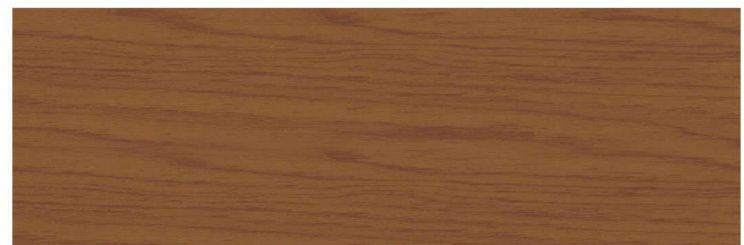
สีไม้วอลนัท Walnut