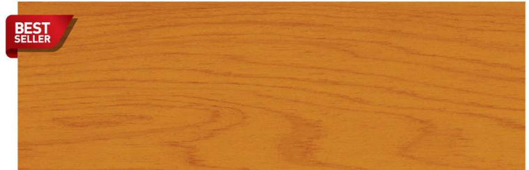
สีไม้สัก Teak