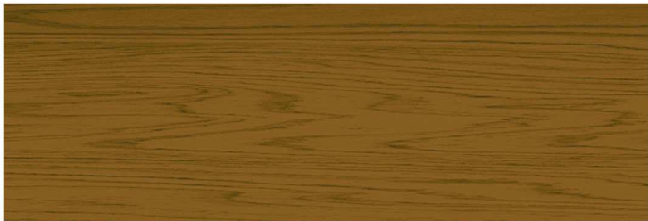
สีไม้ประดู่ Afromosia