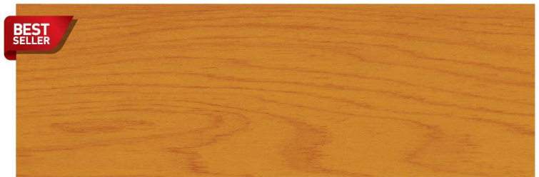
สีไม้สัก Teak