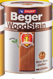
ชนิดกึ่งมา