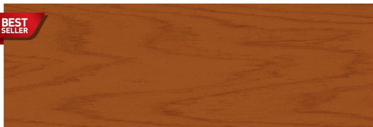
สีไม้มะฮอกกานี Mahogany