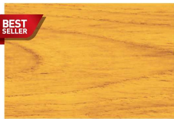
G-1903 สีไม้สัก / Teak