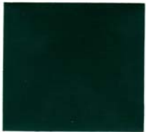
T802** Turf Green