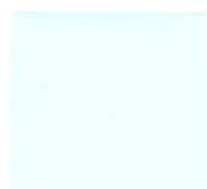
116 Bluish Blue T116 T516