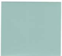
T591 Teal Haze LH.