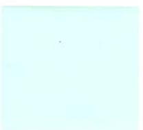
120 Sweet Green T120 T520