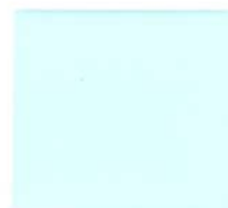
118 Cool Blue T118 T518