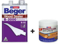
รองพื้นกันยางไม้ เบเยอร์ B-2000 + อุดฟิลเลอร์ เบเยอร์