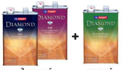
ไดมอนด์ โพลียูรีเทน + เบเยอร์ ทินเนอร์ T-85